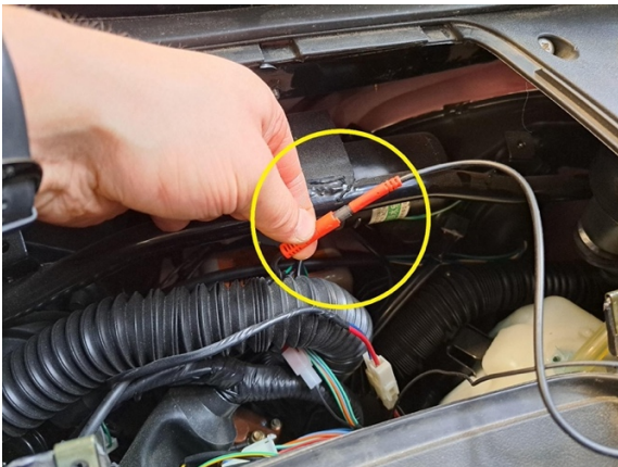
Avaa peruutuskameran signaalijohdon liitin.