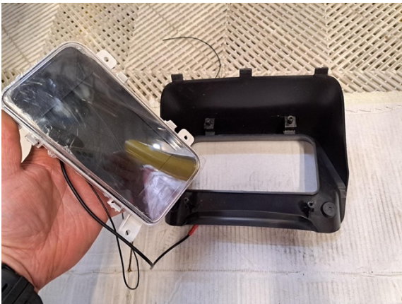
Ota mittaristo pois.

Uuden osan asennus käänteisessä järjestyksessä.